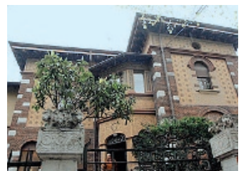
Casa Cottinelli. In via Silvio Pellico

Le strutture mettono a disposizione 41 posti suddivisi in monolocali (a 350 euro al mese), stanze singole (300 euro) e doppie (250 euro per posto letto). Nel bando per il 2018-2019, in scadenza il 24 agosto, sono offerti una decina di posti a tutti gli studenti iscritti ai corsi universitari o di dottorato delle università di Brescia (quindi stata-