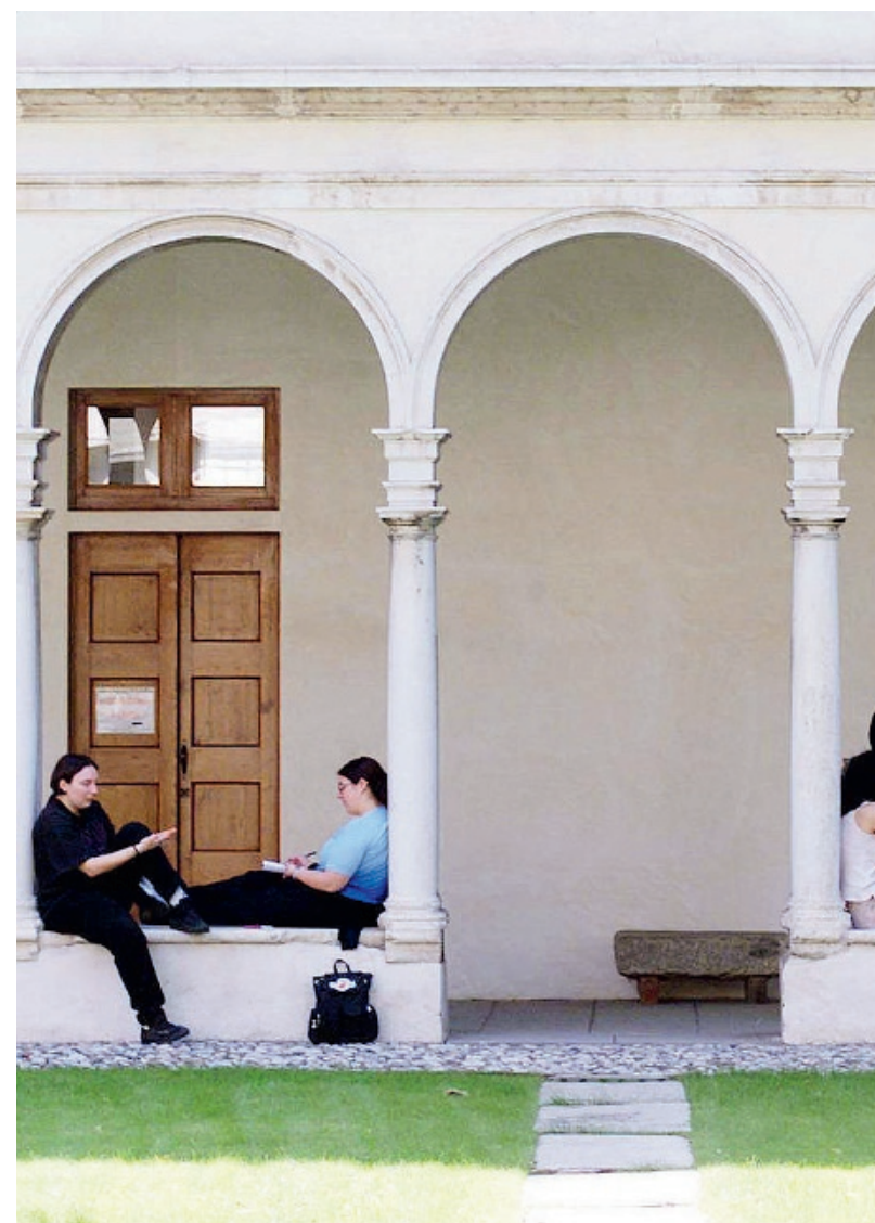
Via San Faustino. Studenti nel chiostro di Economia e commercio

Un ricco ventaglio di possibilità, quindi, per chi sceglie Brescia come meta per formarsi, ma con una crescita a tutto tondo. //