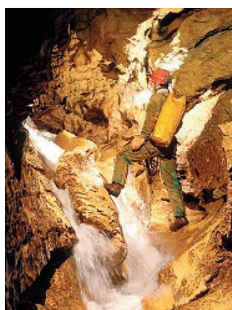
Un'esplorazione. Dal sito dell'ASB

■ Scarponcini da trekking e torcia per sfidare il buio: proseguono le visite guidate nelle viscere del Castello con l'associazione speleologica bresciana. Due gli itinerari proposti: quello «classico», di due o tre ore nella zona più antica della rocca e alle riserve d'acqua (prossimi appuntamenti: oggi, domani, sabato 25 e domenica 26 sempre alle 15) o «speleologico» (prossimi appuntamenti: