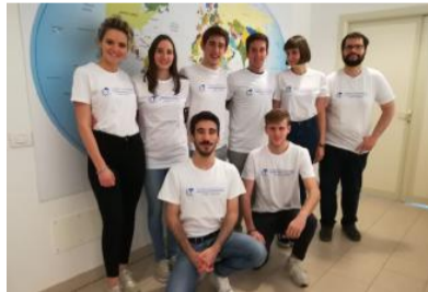
Alcuni dei collegiali ospiti della struttura di Mompiano

de solo con una maturità dall'85 in su e si deve mantenere la media del 27. Costa 550 euro al mese, ma parecchie sono le borse di studio per i talenti. Il prossimo ban-