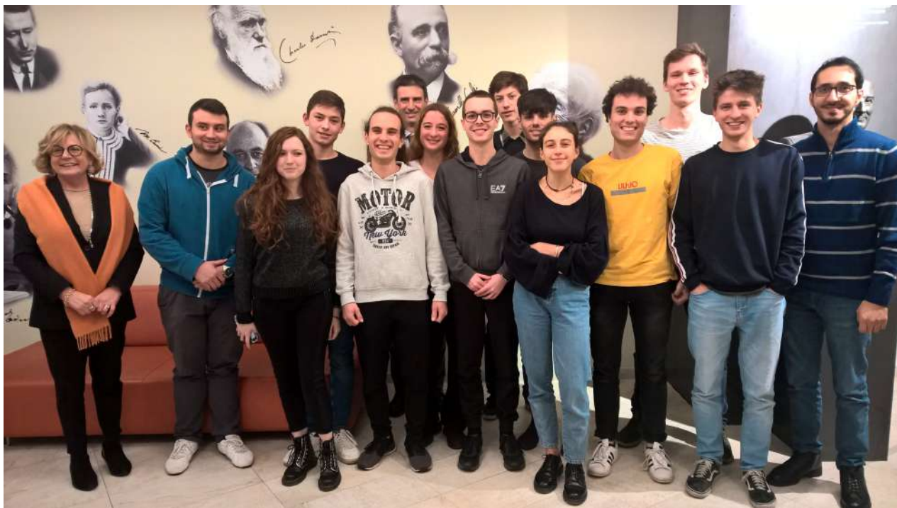
-Incontro di presentazione dei Ph.D. del Collegio (28.01.2020)